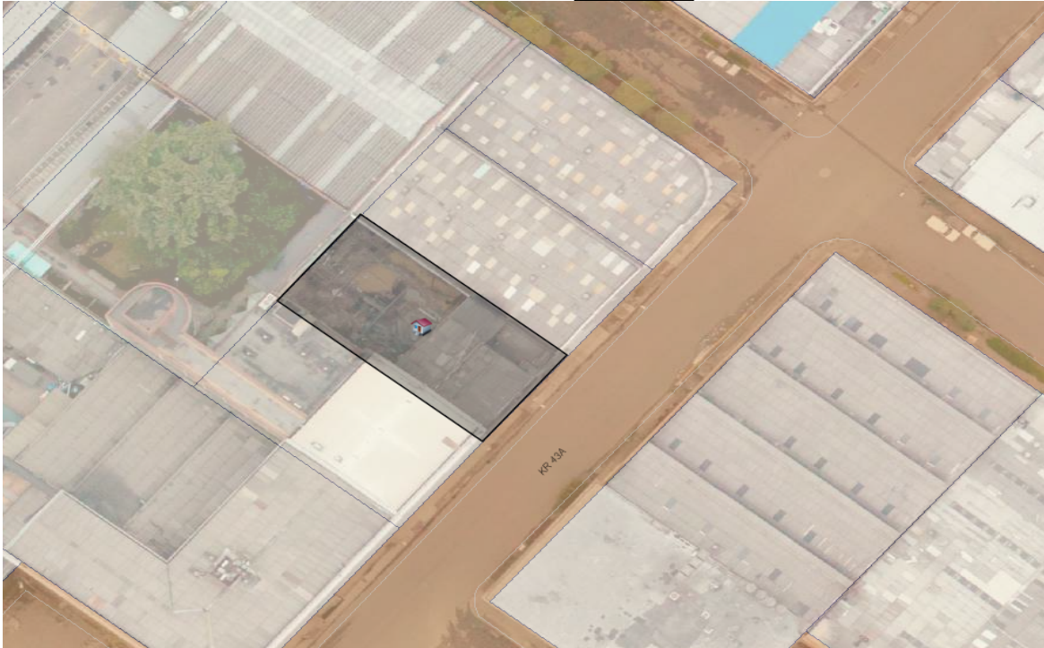
Figura 3. Ubicación del predio donde se localiza el pozo pz-16-0009

Durante la visita de control se observó que en el predio actualmente funciona la empresa ARBOFARMA S.A.S, quienes utilizan este predio como bodega de almacenamiento; no es posible observar la boca de la captación dado que esta se encuentra bajo una placa de concreto y baldosa.