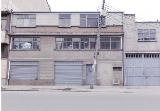
Fotografía 1. Predio donde se ubica el pozo pz-16-0009.