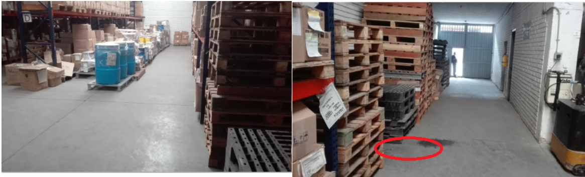
Fotografía 2. Interior del predio donde se ubica el pozo pz-16-0009